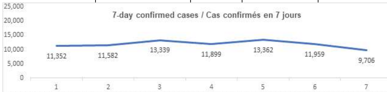
Daily Count / Nombre quotidien